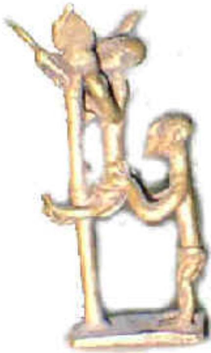
“Apoyando al amigo”. Escultura en bronce proveniente de Ghana.