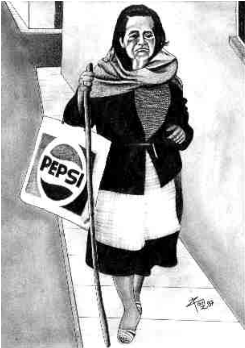
"Lusa Loca" Arte: Raúl Espinosa Njángos