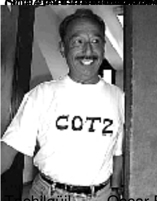
Jachigüil Oscar Bonifaz Pesadilla Comiteca