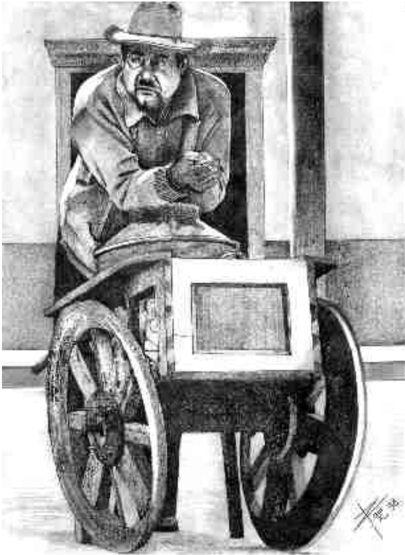
"El nevero" Arte: Raúl Espinosa Mijangos